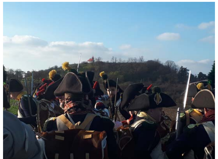
Quelques instantanés du week-end