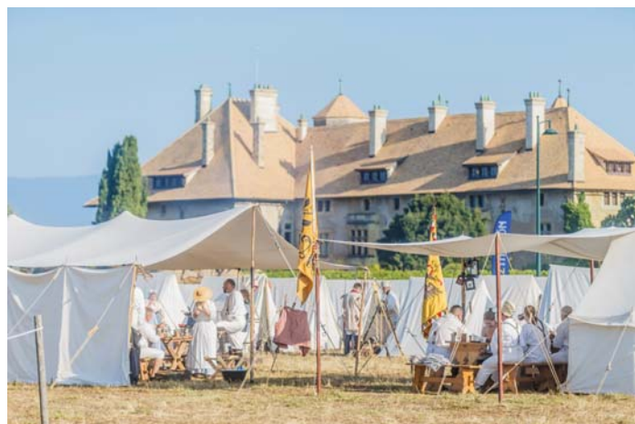
Quelques instantanés du week-end