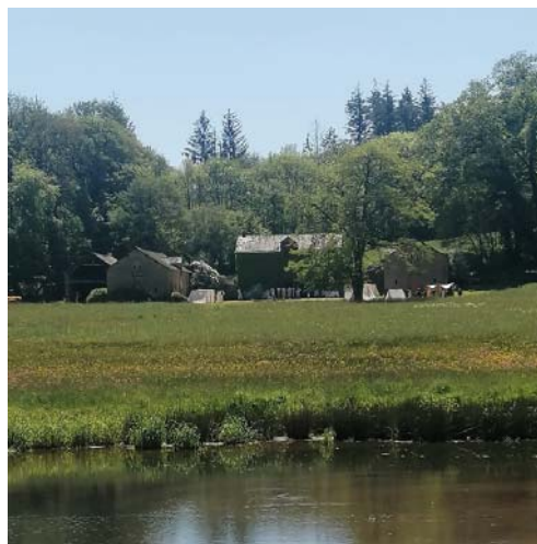
Une magnifique vue du campement