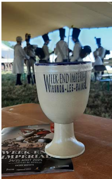
Le cadeau souvenir remis à chaque participant-e