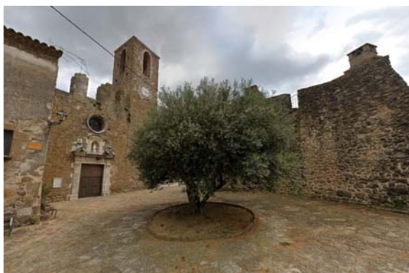
Le centre d'Ultramort