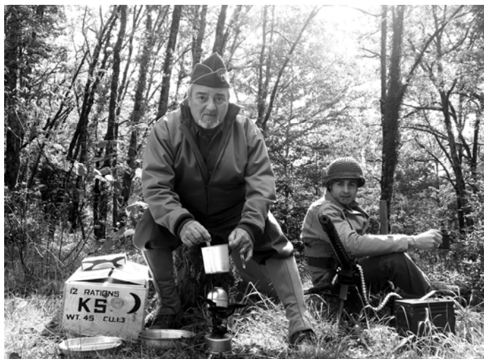
Quelques instantanés du week-end