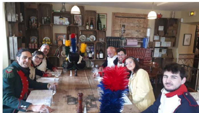
Quelques instantanés de la matinée