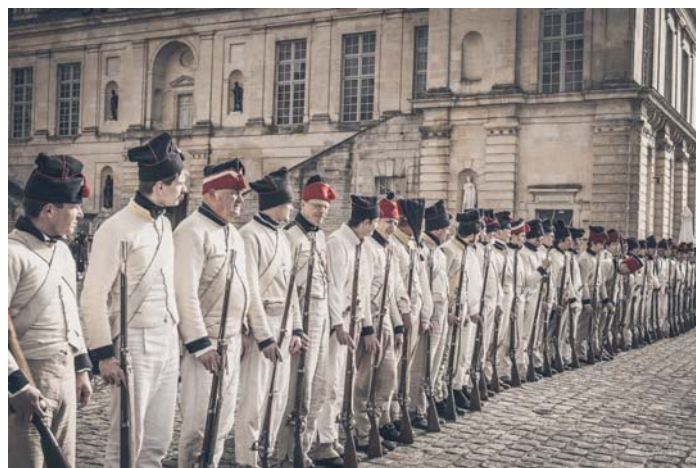
Quelques instantanés du week-end