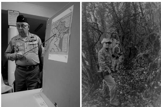
Le planqué-conférencier au chaud et ... les voltigeurs dans le froid humide