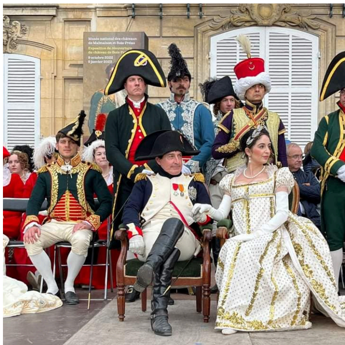
L'Empereur et sa cour.