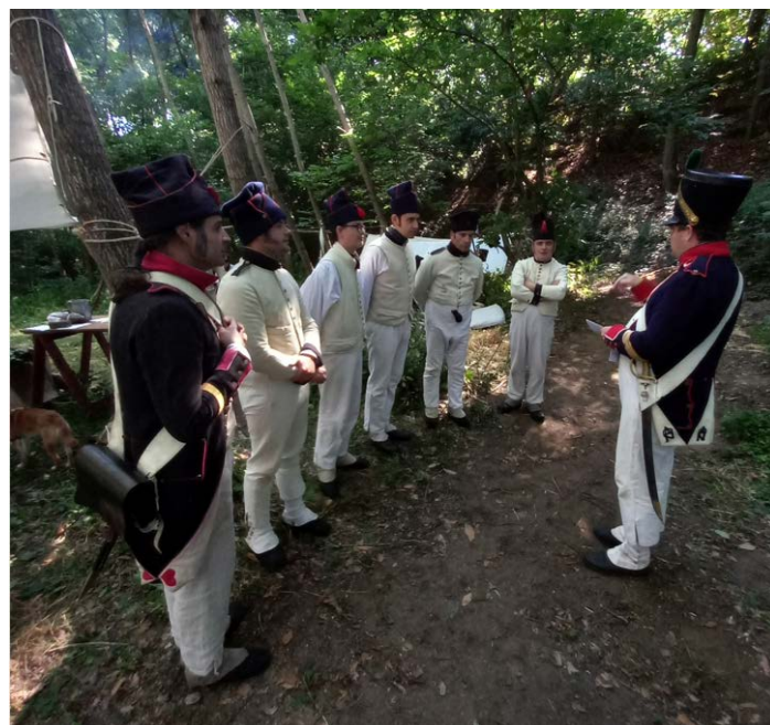
Quelques soldats à l'instruction sur les honneurs intérieurs.