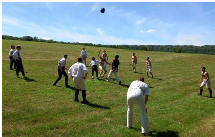
Avant une bonne et mâle partie de soule !