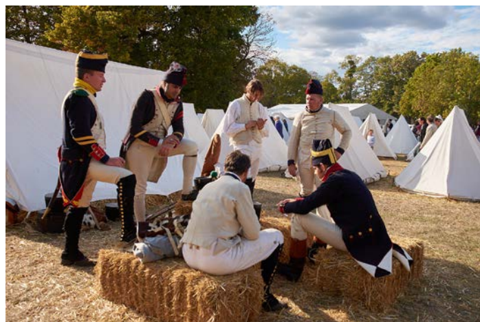
Scène de vie au campement.