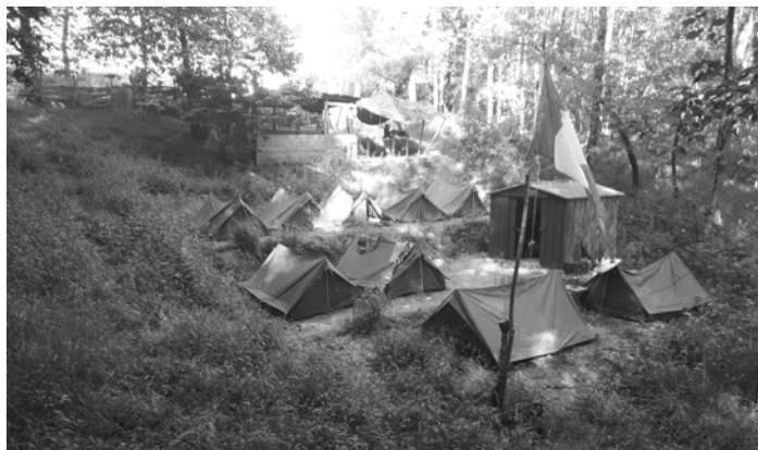
Le poste tonkinois de Thru Duc n'a jamais été aussi peuplé.