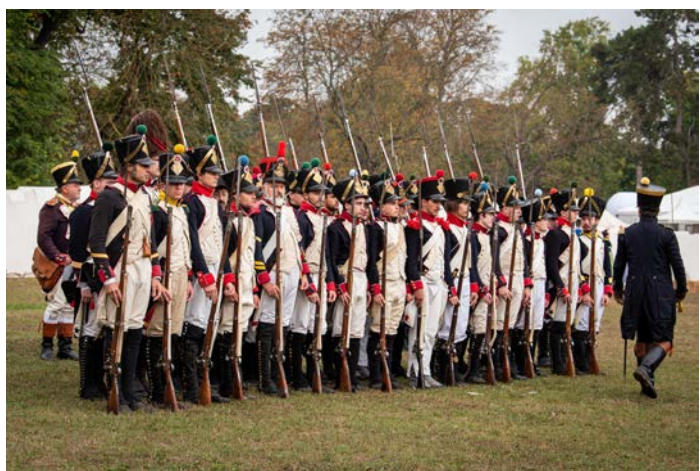
Le peloton prêt pour la revue de l'Empereur.