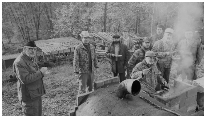
Le GM 18 au poste de Thru Duc.