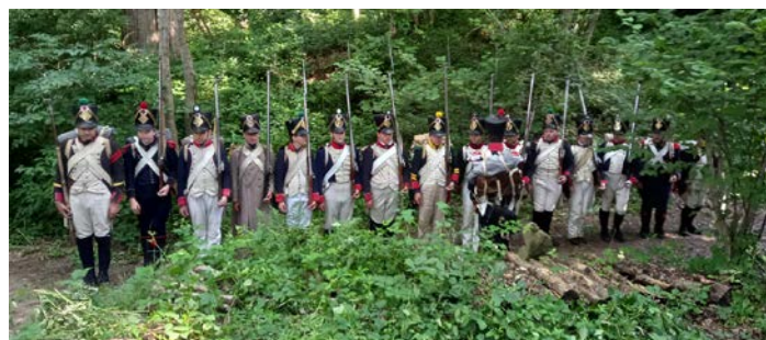
L'ensemble de peloton se prépare pour la revue dominicale...