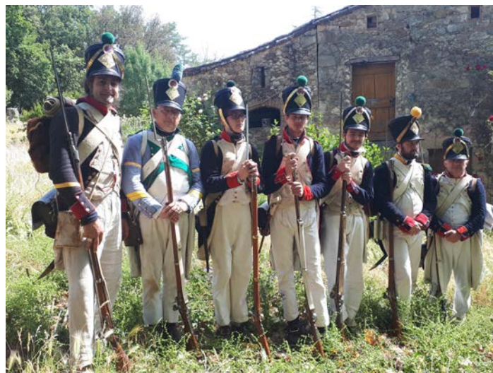
La section pose pour la postérité ...