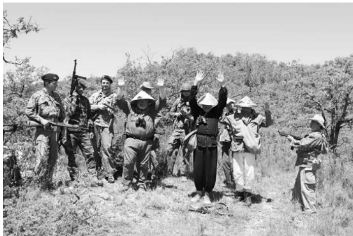
L'ennemi est pris ...