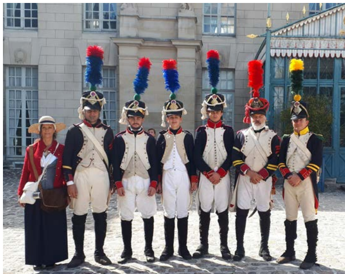
L'escouade du 18 ème en visite à la Malmaison ...