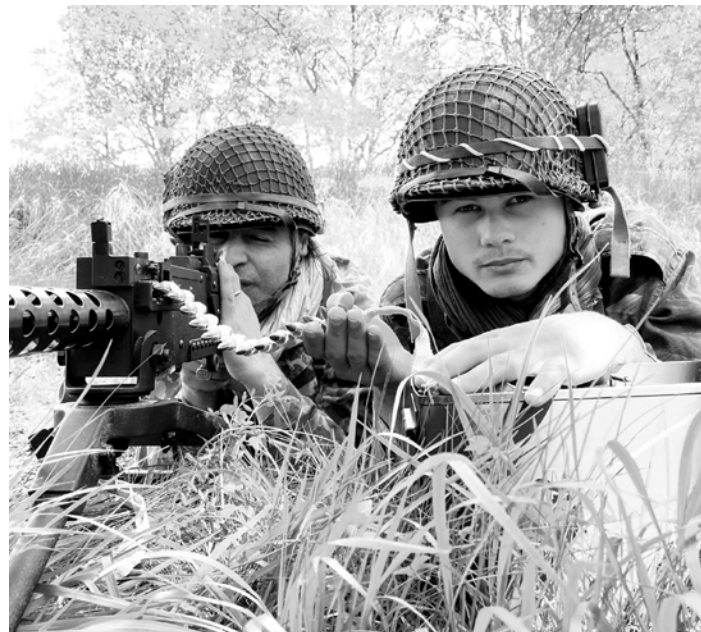
Attention, ça va staffer !