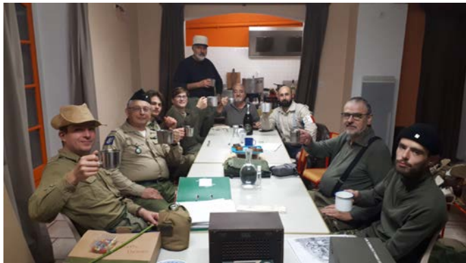
Le toast à la longue vie de l'association