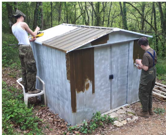
Le travail c'est la santé ...