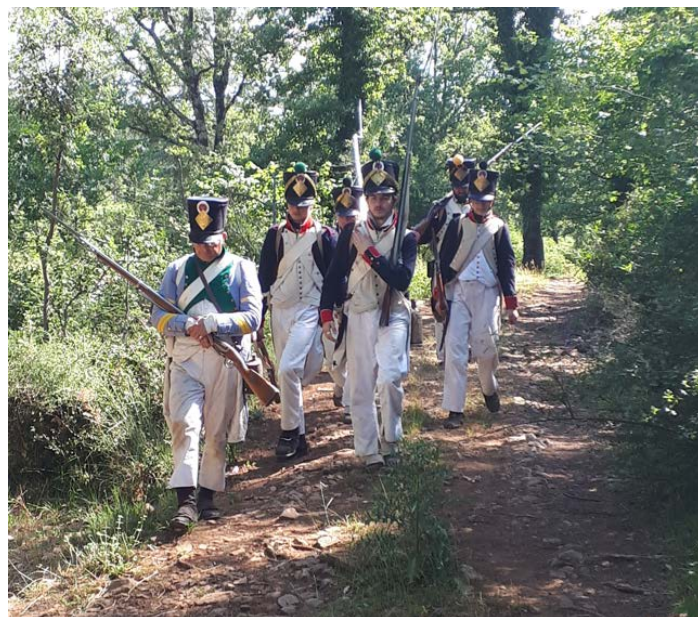
Avant de se remettre en marche ...