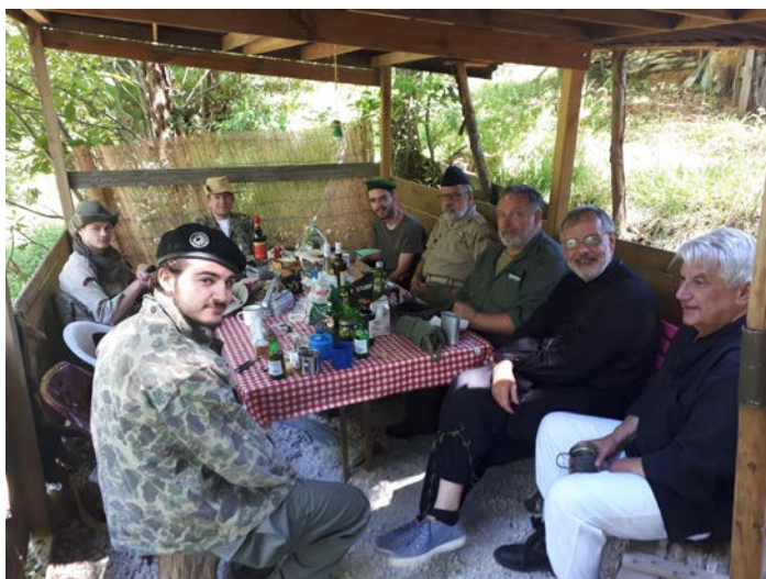
Ça tombe bien, c'est l'heure de l'apéro !