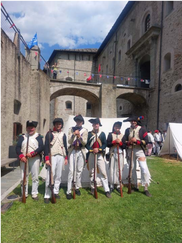
L'escouade du 18 ème ...