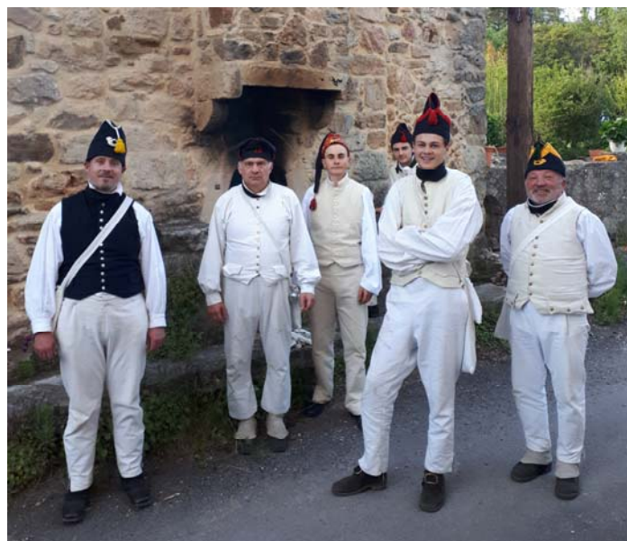
Photos : les soldats en action et au repos.