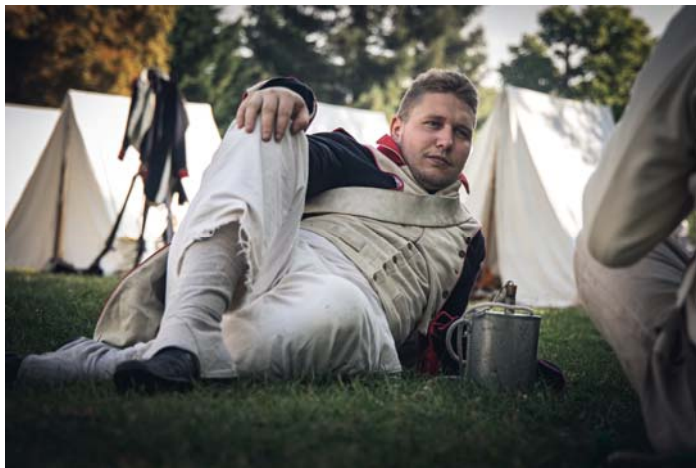
Un jeune soldat blond aux yeux bleus se repose ...