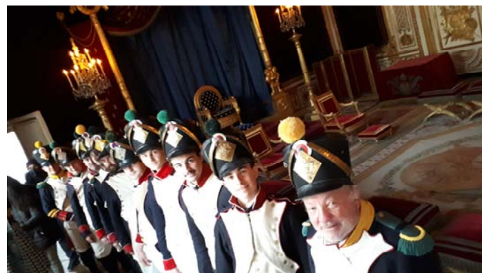
Dans la salle du trône du château ...