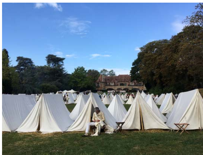
Le campement dans le parc du château de St-Cloud.