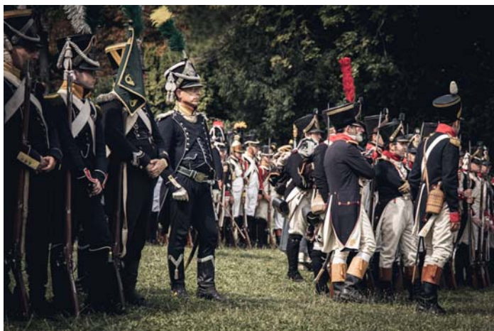
L'infanterie à l'exercice.