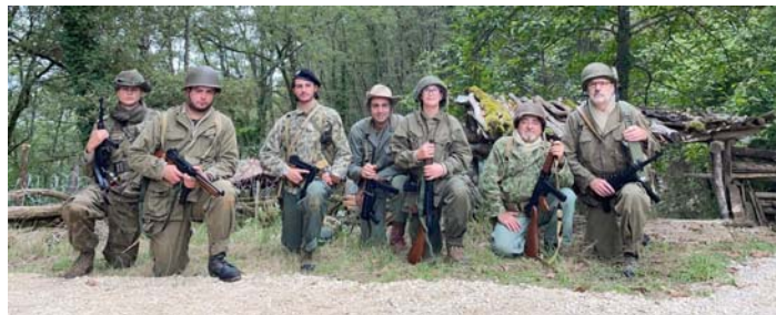
Photos : le GM 18 et son poste tonkinois.