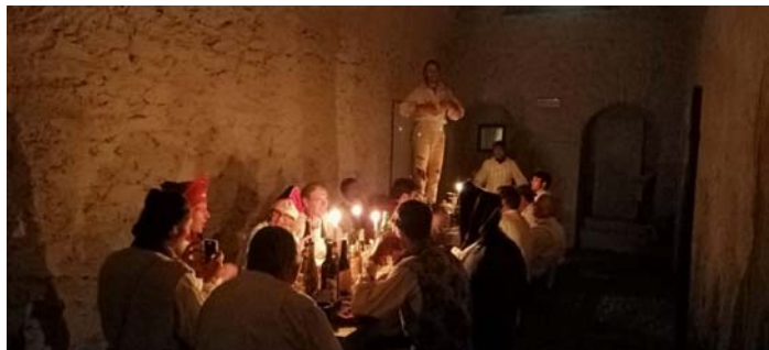
Le soir, à la taverne ...