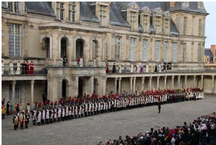
L'Empereur passe la troupe en revue dans la cour d'honneur.