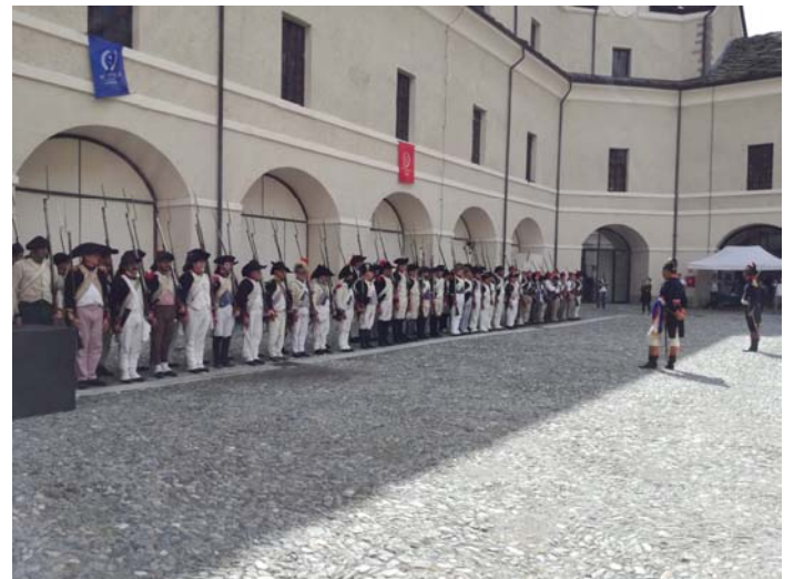
Le 1 er Consul passe la troupe en revue.