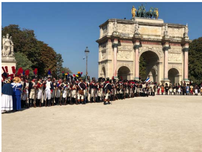
La troupe regroupée devant l'arc de triomphe du Carrousel.