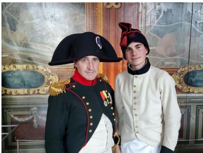
Certains sont prêts à toutes les bassesses pour un peu d'avancement ...