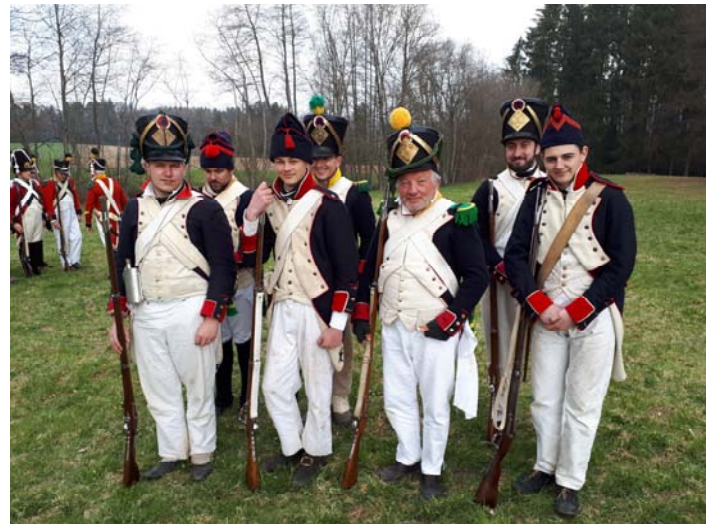
Le petit peloton du 18 ème .