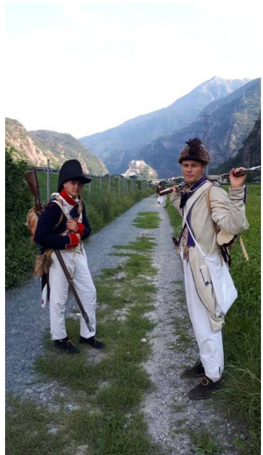
Le fort est en vue !