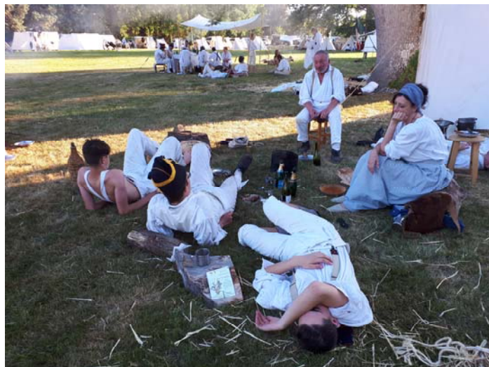
La chaleur est une excuse au farniente .