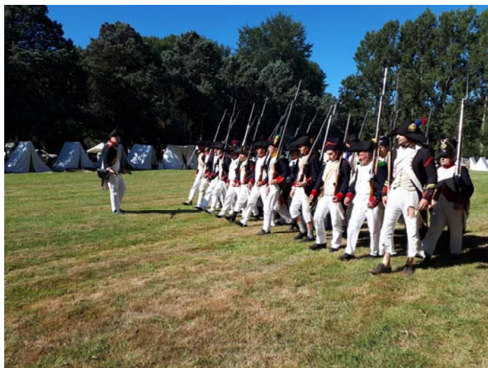
18 ème , 40 ème et 44 ème réunis pour former un peloton.