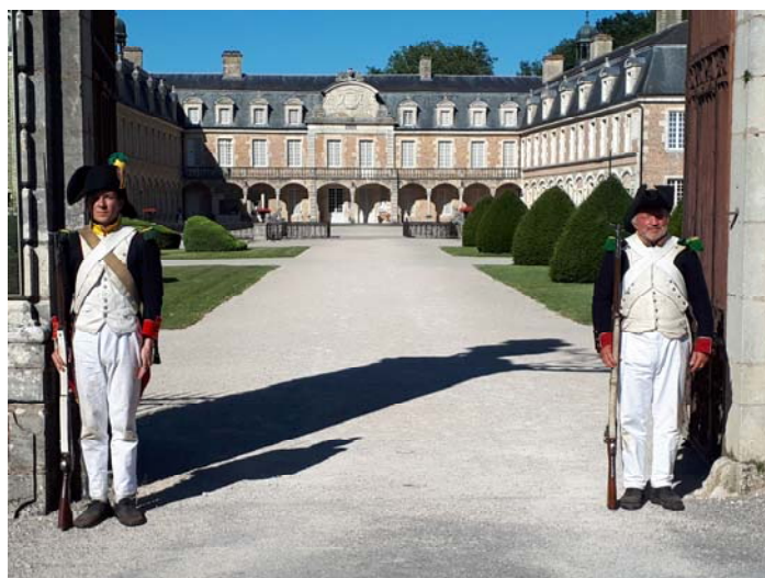
Le 18 ème est de garde au château.