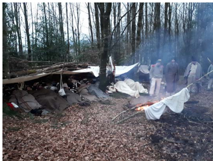
La section française au bivouac.