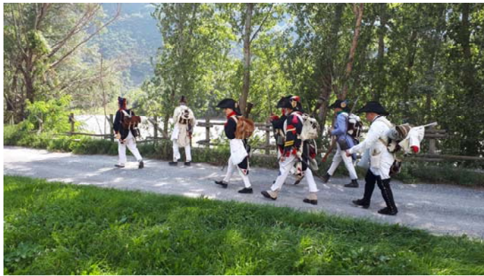
En route, le peloton longe la Dora Baltea.