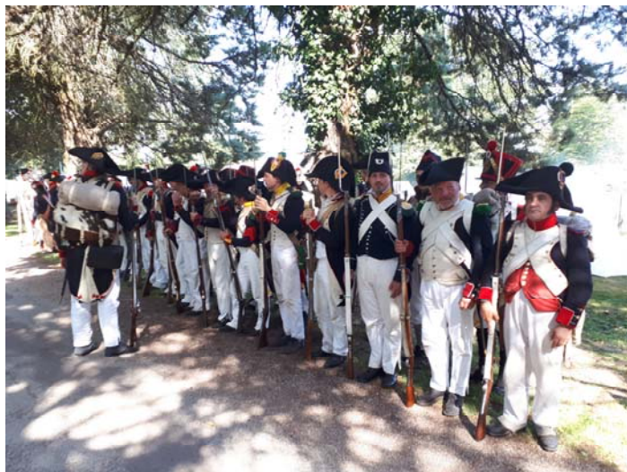
Prêts pour le défilé.