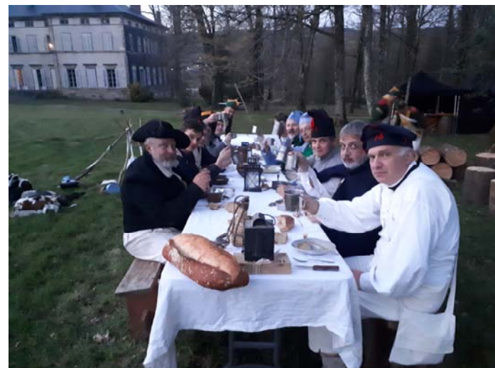
Le campement de toile et la tablée dans le parc du château.