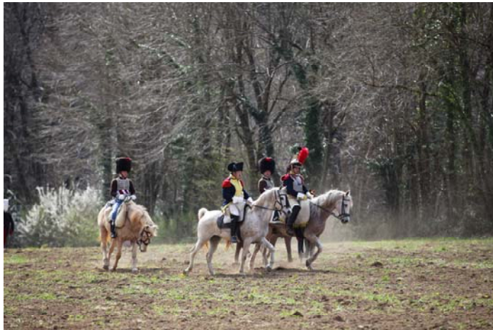
Les démonstrations de cavalerie.