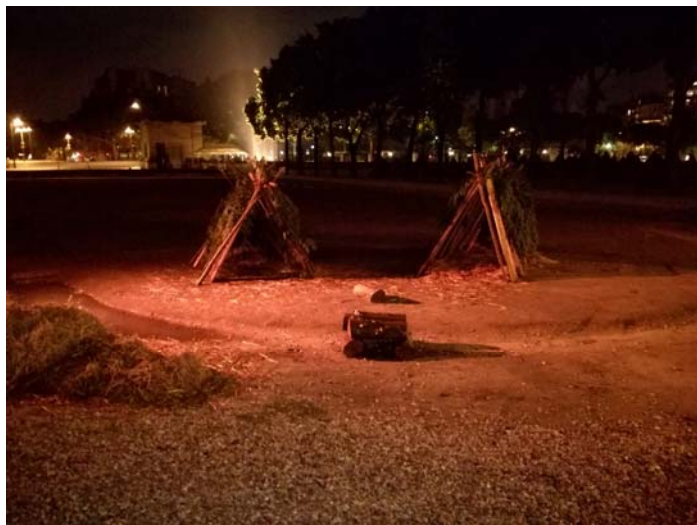
Les abris du bivouac