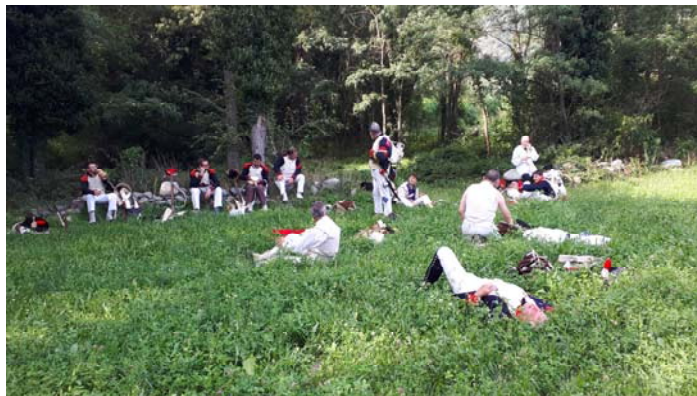
Grosse halte à Echallod.