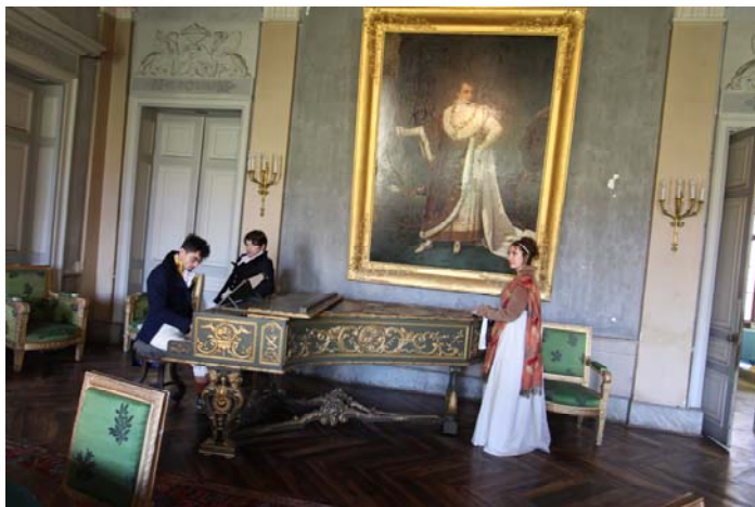
Tableau vivant dans le château.

participants a pu se dégourdir les guêtres avant de reprendre le chemin des campagnes.