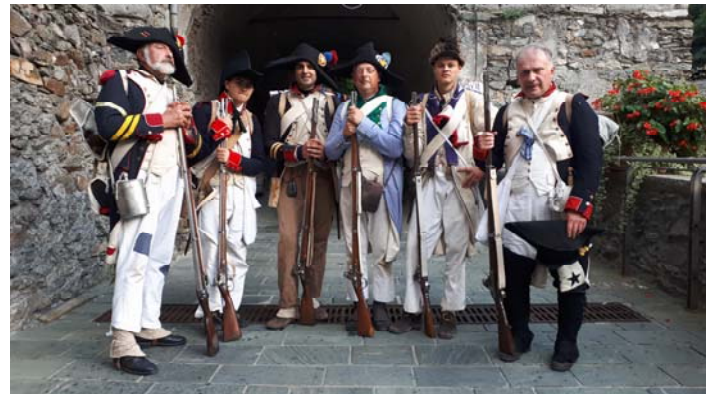
L'escouade du 18 ème est enfin à Bard.