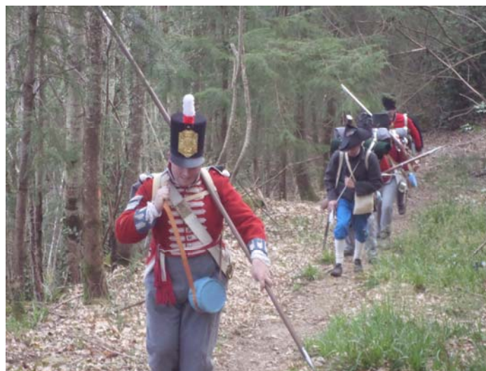
Les troupes en plein effort.