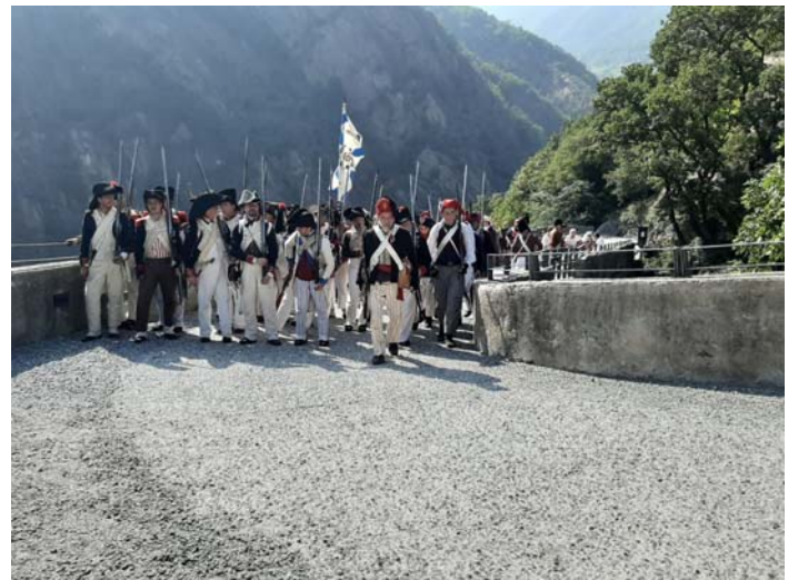
Le 40 ème , à l'assaut du fort