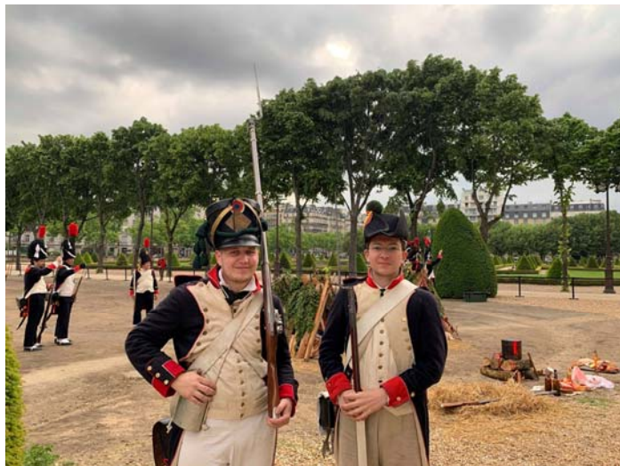
Les fusiliers et voltigeurs du 18 ème