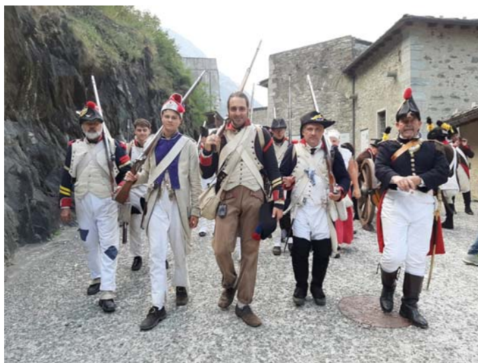
Le fort est pris !