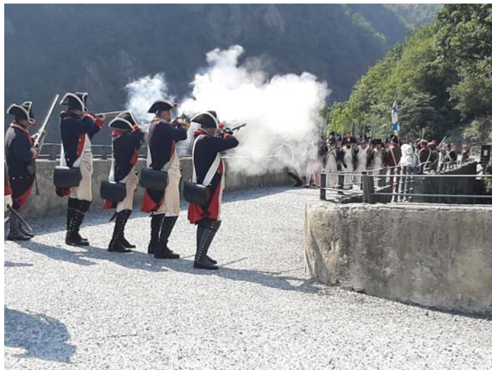
Les austro-piémontais se défendent.