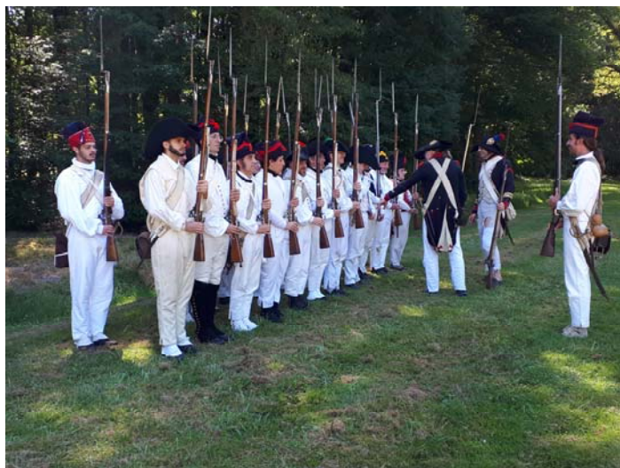
Maniement d'arme à l'ombre.