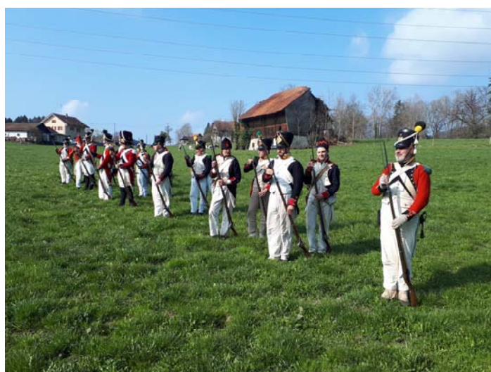
Photos : les soldats à l'exercice, pratique et théorique.