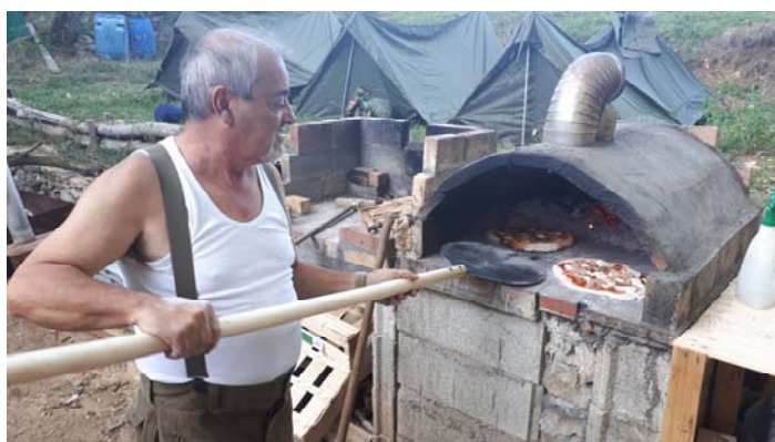
Photos : le GM 18 en patrouille dans les parages de son poste tonkinois.