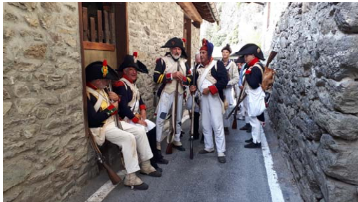
Petite halte à Arnad.