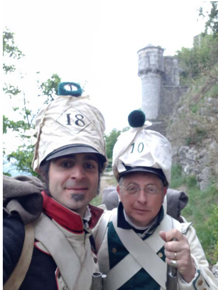
18 ème et 10 ème Cie du Tarn en marche d'approche