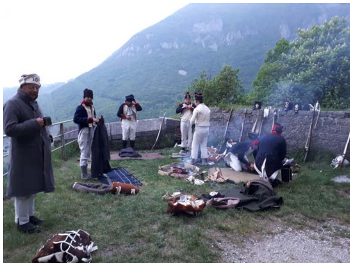
Le réveil du bivouac au fort supérieur