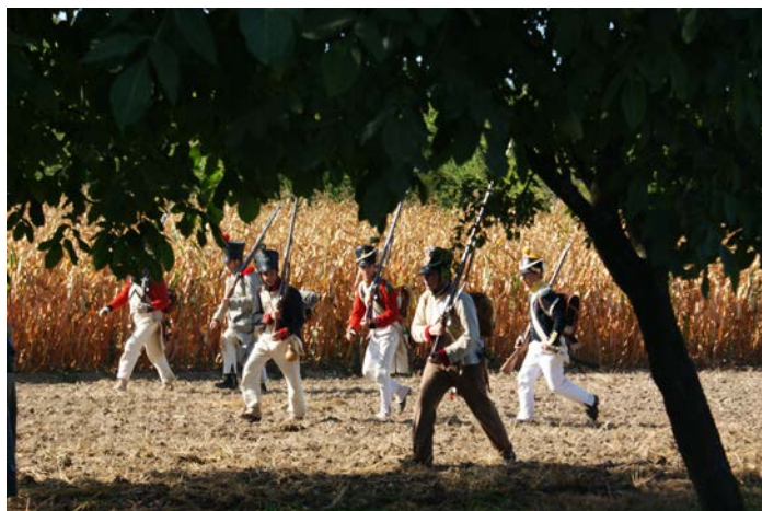
Voltigeurs, déployez-vous !