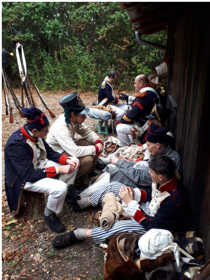
Les fantassins cassent rapidement une graine