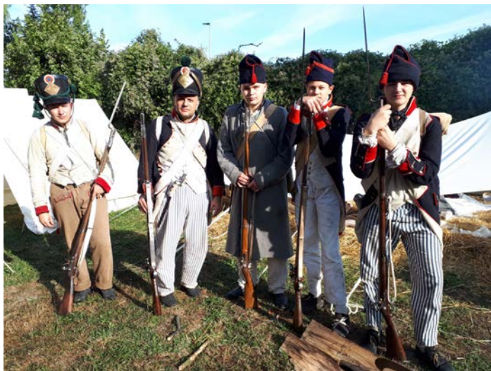
Le 18 ème prend la pose