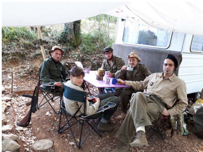
Photos : l'AG au poste tonkinois.

PS : pour plus de détails sur les discussions, nous encourageons les membres à se reporter au PV qui leur a déjà été adressé.