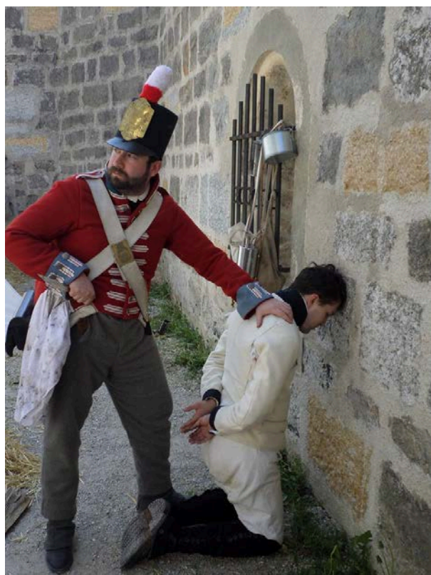
Un prisonnier français torturé par les chasseurs britanniques