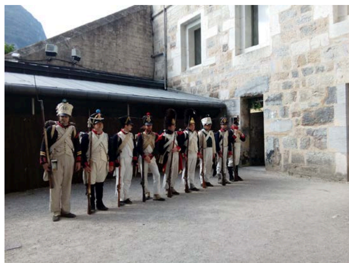
L'escouade mobile prête à partir en mission de reconnaissance