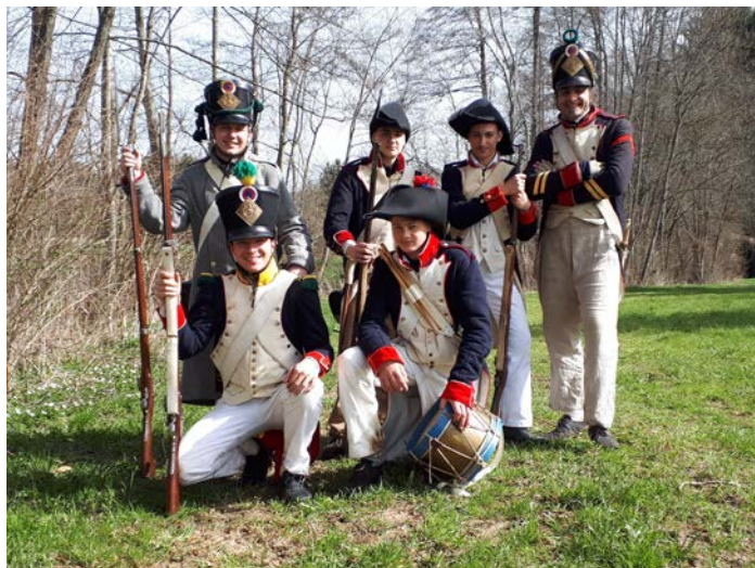
Le petit peloton du 18 ème .