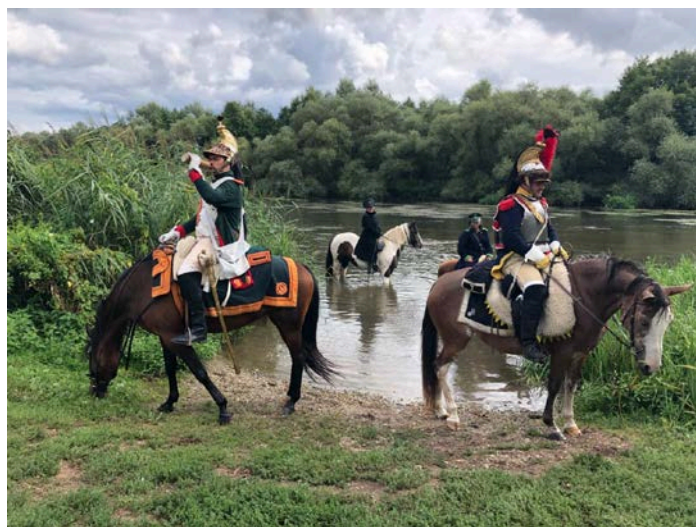
Les cavaliers et leurs montures s'abreuvent