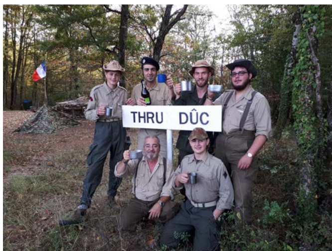
Photos : le GM 18 et son poste avancé.