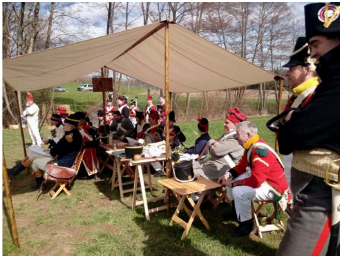
Photos : les soldats à l'exercice, pratique et théorique.