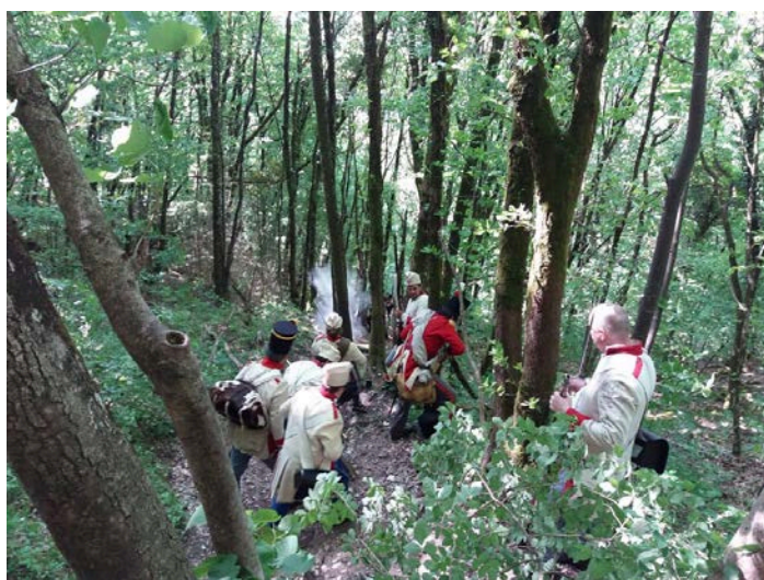
Les combats dans les bois