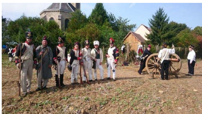
Le 18 ème prend la pose