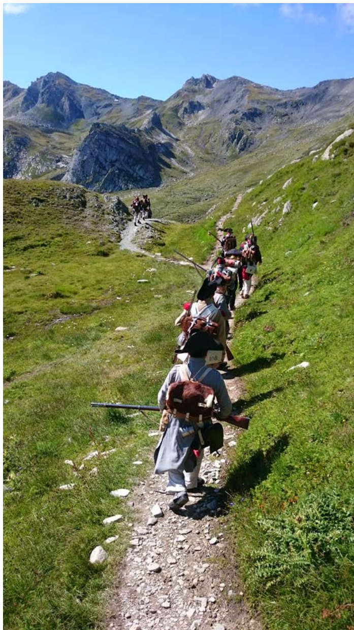
Les pelotons en marche vers le col