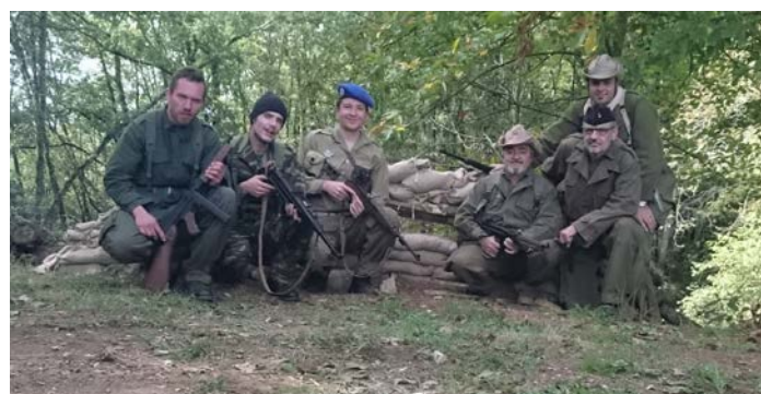
Photos : le GM 18 et son poste avancé.