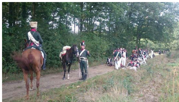
Les troupes en pause