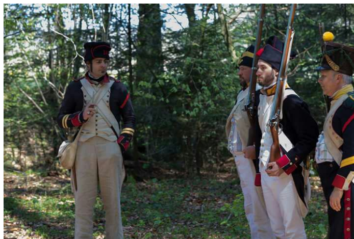
Photos : les soldats à l'exercice.