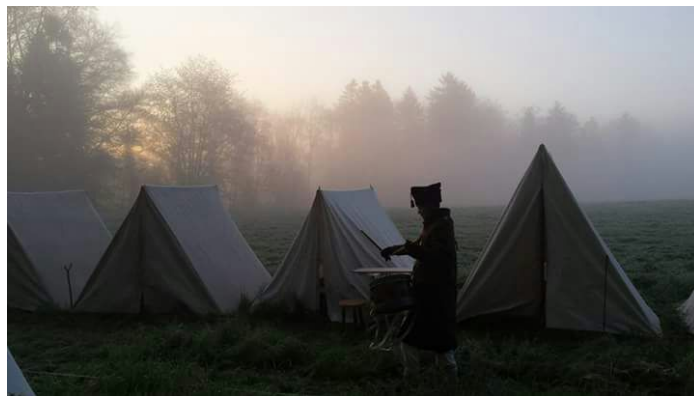
Le réveil du bivouac