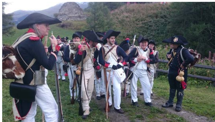
Les pelotons formés pour le départ