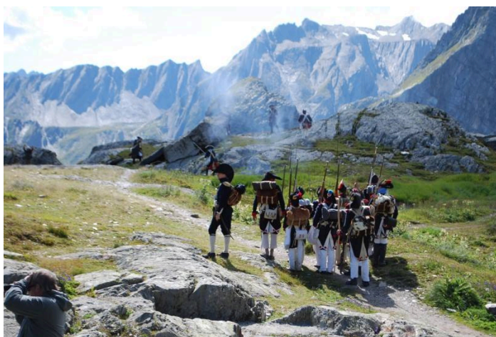
La bataille au Mt Jupiter