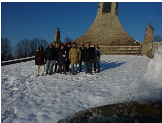
Le groupe au monument de la paix au Pratzen