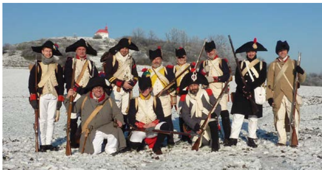
Le groupe au pied du Santon