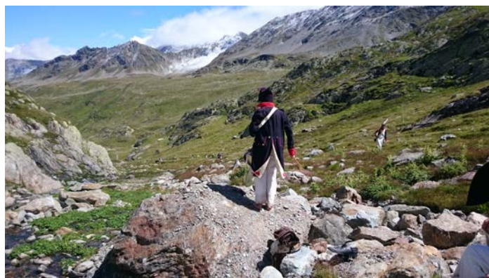
Le tambour bat la charge dans la Combe aux Morts