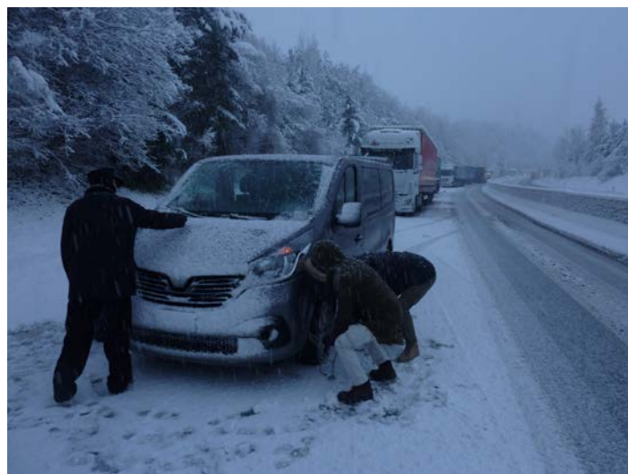
Pose des chaines sur l'autoroute