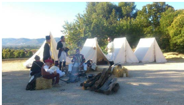
Le bivouac du 18 ème