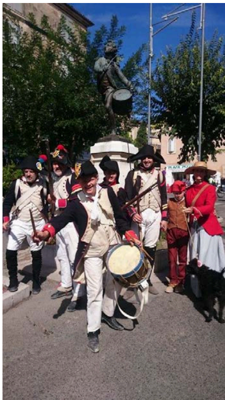
Le 18 ème pose devant la statue du petit tambour d'Arcole