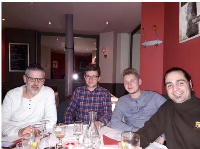
Photos : l'AG à la pizzeria.

PS : pour plus de détails sur les discussions nous encourageons les membres à se reporter au PV qui leur a déjà été adressé.