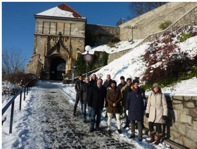
Le groupe en visite de Bratislava